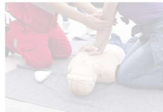
Nothilfe und Notfälle