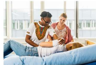
Pflege und Betreuung