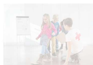
Eltern und Familien/chili