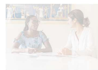
INFO Point / Einzelhilfe

Lange gut zu Hause leben | Schweizerisches Rotes Kreuz Luzern ( srk-luzern.ch )