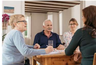
Beratung zu Hause