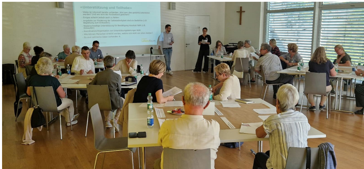
7 Werkstattgespräch Alter: «Projekt Netzwerk 4Ge» vom 23.10.2023