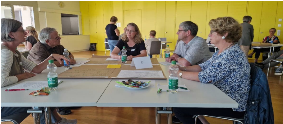
5 Werkstattgespräch Alter: «Projekt Netzwerk 4Ge» vom 23.10.2023