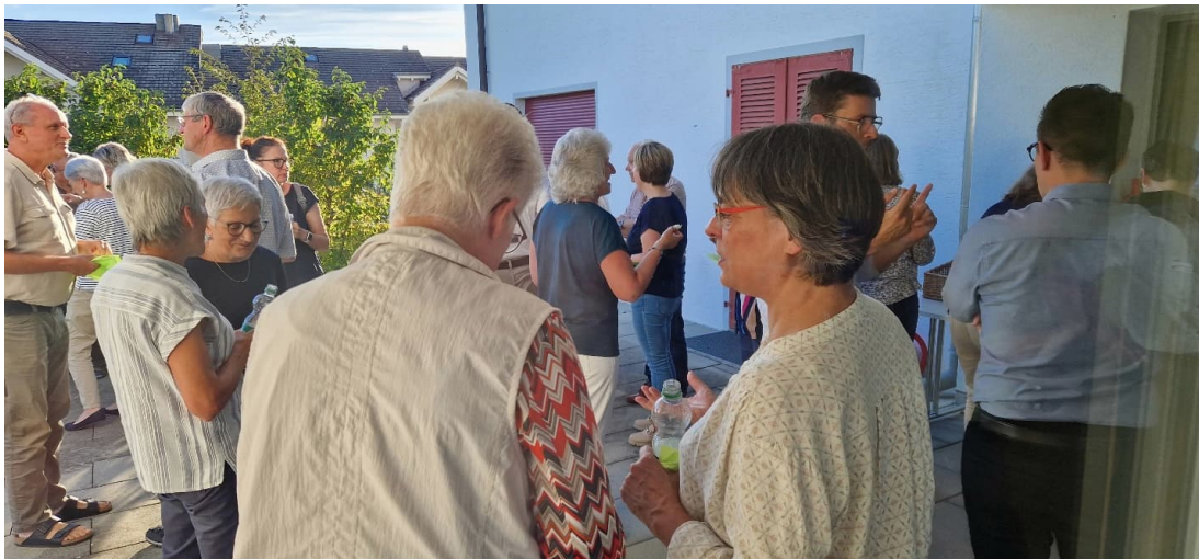
6 Werkstattgespräch Alter: «Projekt Netzwerk 4Ge» vom 23.10.2023