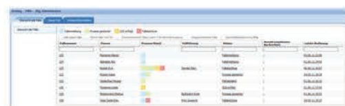
Fallübersicht im CaseNet

Nach erfolgreicher Anmeldung sehen Sie alle Fälle bei denen Sie mitarbeiten oder die Vollmacht haben, Informationen auszutauschen. Klicken Sie auf den Namen der gewünschten Person, um weitere detaillierte Fallinformationen zu erhalten. Klicken Sie auf „Fallübersicht“ um einen Überblick über die Inhalte im Forum, die zur Verfügung stehenden Dokumente, die Fallteilnehmer/-innen oder die anstehenden Termine zu erhalten. Falls Sie wiederum auf die Gesamtübersicht Ihrer Fälle gelangen wollen, klicken Sie in der obersten Bildschirmleiste unter dem Menü „Einstieg“ auf „Übersicht alle Fälle“.