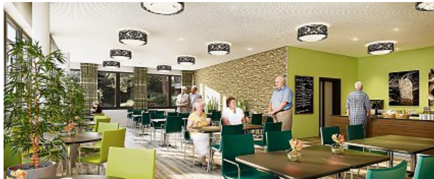
Das zukünftige Bistro des Hauses