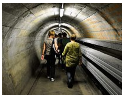
Der Bunker hautnah.

Die grösste Zivilschutzanlage der Welt – und das mitten im Sonnenberg Kriens-Luzern. Auf einer zweistündigen Führung erhält man nun Einblick in den ehemaligen Riesenbunker und erfährt viel Interessantes über diesen spektakulären Zeugen des Kalten Krieges und der Atomangst, sowie seine aktuelle Nutzung.