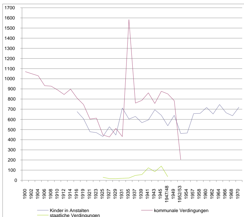
Grafik: Statistik über die Verdingkinder und in Anstalten versorgten Kinder im Kanton Luzern. 137

danach kontinuierlich ab. Kinderheimgründungen führten beispielsweise dazu, dass die Verdingung von Kindern jeweils abnahm, so 1916, als in Schüpfheim das Kinderasyl eröffnet wurde. Meist waren aber bis zur Jahrhundertmitte mehr Kinder an Bauern verdingt als in Anstalten versorgt worden, dies besonders während der Krisenjahre in den 1930ern/40ern und es wurden in dieser Zeit gar staatliche Verdingungen verordnet. War diese Praxis des Verdingens schon früh bei den kantonalen Behörden umstritten, so erfuhr sie erst in den 1950er Jahren einen deutlichen Abbruch und die Kinder wurden fortan in „Pflegefamilien“ untergebracht. 136